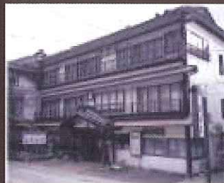
③あつみホテル温泉荘