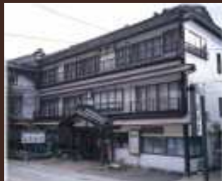
②あつみホテル温海荘