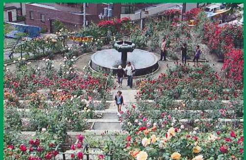
あつみ温泉バラ園