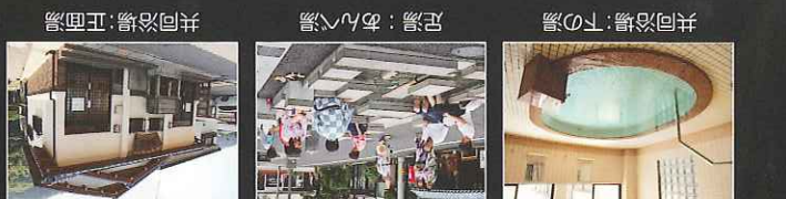
登山後はさかみ温泉へ 気軽に入れる共同浴場や足湯があります。